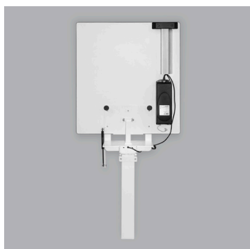
Bordplade vippet op.