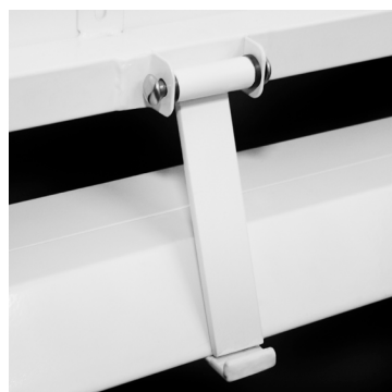
Sikkerheds låse mekanisme.