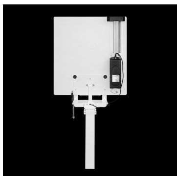
Bordplade vippet op.