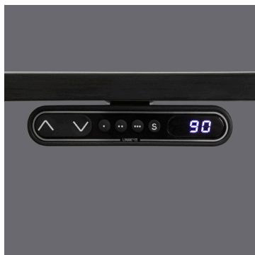
Bordbetjening med display.